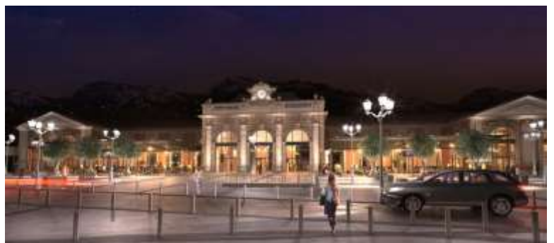
Gare de Toulon

Je n'ai pas d'endroit préféré en France, mais la gare de Toulon est probablement ce qui y est le plus proche. La raison : chaque voyage que je fais commence à cet endroit. Et c'est également un grand plaisir de voir cette gare quand je rentre de mes voyages : ses murs jaunes, la fontaine et les palmiers m'assurent toujours que je suis bien arrivé chez moi !