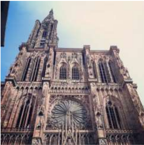
Cathédrale Notre Dame de Strasbourg

À la cathédrale Notre Dame de Strasbourg sur la place du Château. S'il fait beau temps, alors c'est fantastique là-bas. On peut y découvrir tellement de choses et on a une vue fascinante sur la cathédrale.